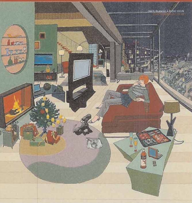
Illustration: Elene Usdin.